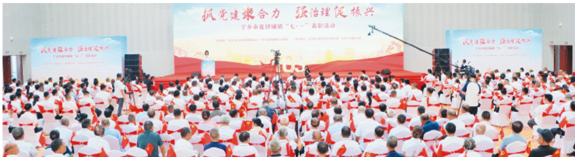
宁乡夏铎铺镇召开“抓党建聚合力，强治理促振兴”七一表彰大会。

全镇突出乡村振兴强引擎，完成耕地恢复验收1010.62亩，完成比例达108.09%，成功创建2023年双季稻轮作示范乡镇；全力推动村级集体经济再上新台阶，全镇9个村（社区）集体经济收入超1200万元；顺利通过国家卫生乡镇复审，年度人居环境工作位居宁乡市前列；成功打造湖南省林长制工作先进单位；建成美丽宜居村庄3个，石仑关获评“湖南省五星级乡村旅游区”。