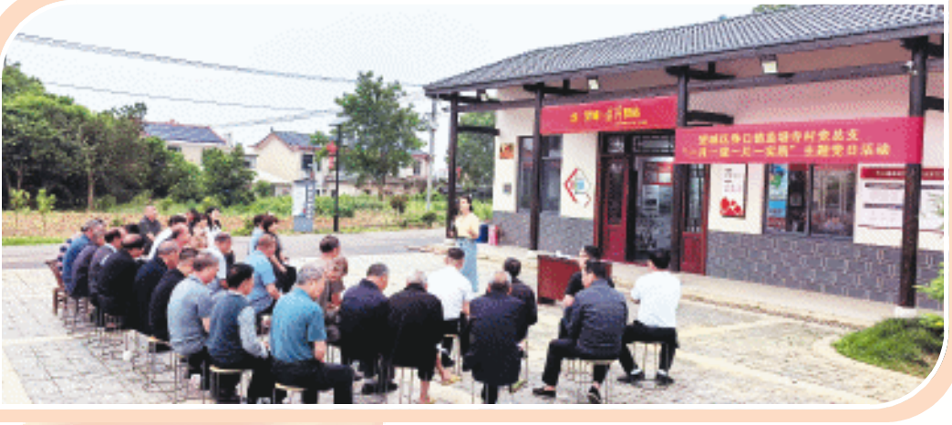
望城区积极探索创新支部活动形式,打造特色活动载体。

如今,望城党员队伍进一步发展壮大,基层党组织作用进一步加强,锤炼党性、激发活力的熔炉越烧越旺。