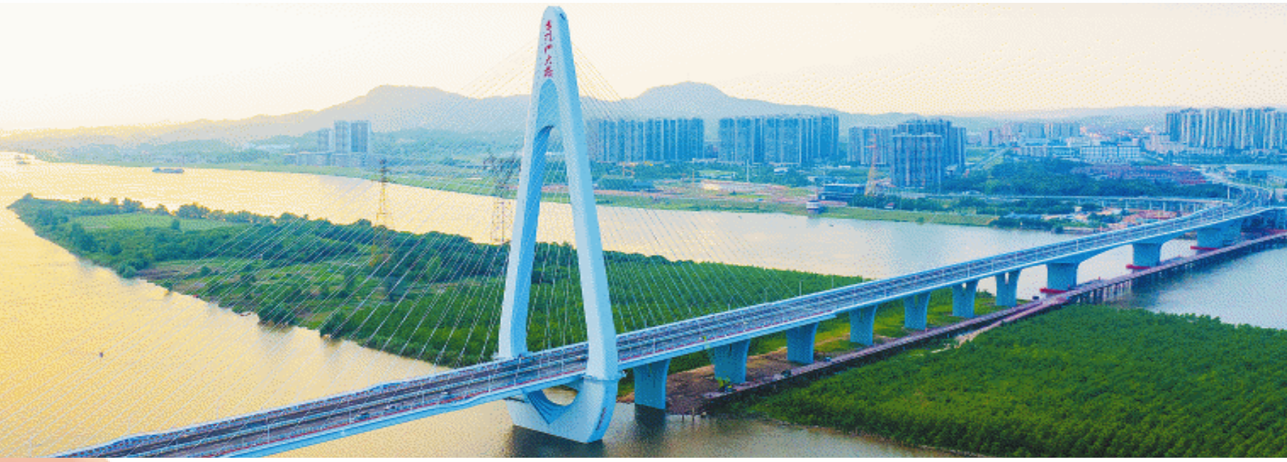
在望城,无论是抗洪救灾的一线,还是经济发展的前沿,或是服务群众的基层,处处都有党员干部奋勇争先、率先垂范的身影。