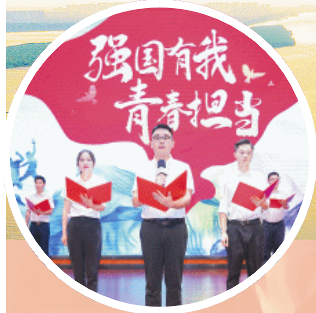
2024年望城区年轻干部“四炼”营结业汇报会充分展现了年轻干部踔厉奋发的精神面貌和投身发展浪潮的自信与决心。