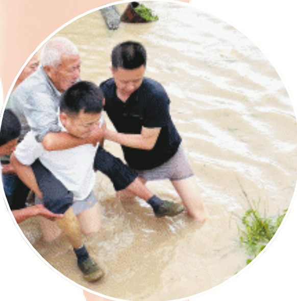
望城党员干部跳进洪水中,将受困老人转移到安全地带。