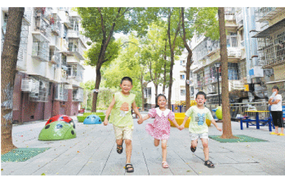
提质改造后的木材厂小区乒乓球台、健身器材等设施一应俱全。

“我们在改造中不仅注重‘面子’，更注重‘里子’。”社区工作人员说，小区一方面在硬件上提质升级，新建及疏通了下水道，梳理了小区内的电线等线路。