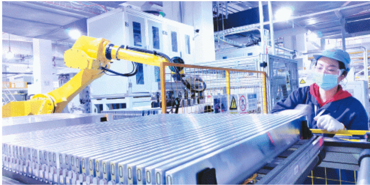
长沙弗迪电池生产的“刀片电池”受到业界青睐。

当好耕耘者，种好责任田。宁乡这座充满朝气的千年古邑，正用“拼”的精神、“闯”的劲头、“实”的干劲，以新气象新作为奋力开新局、启新程。