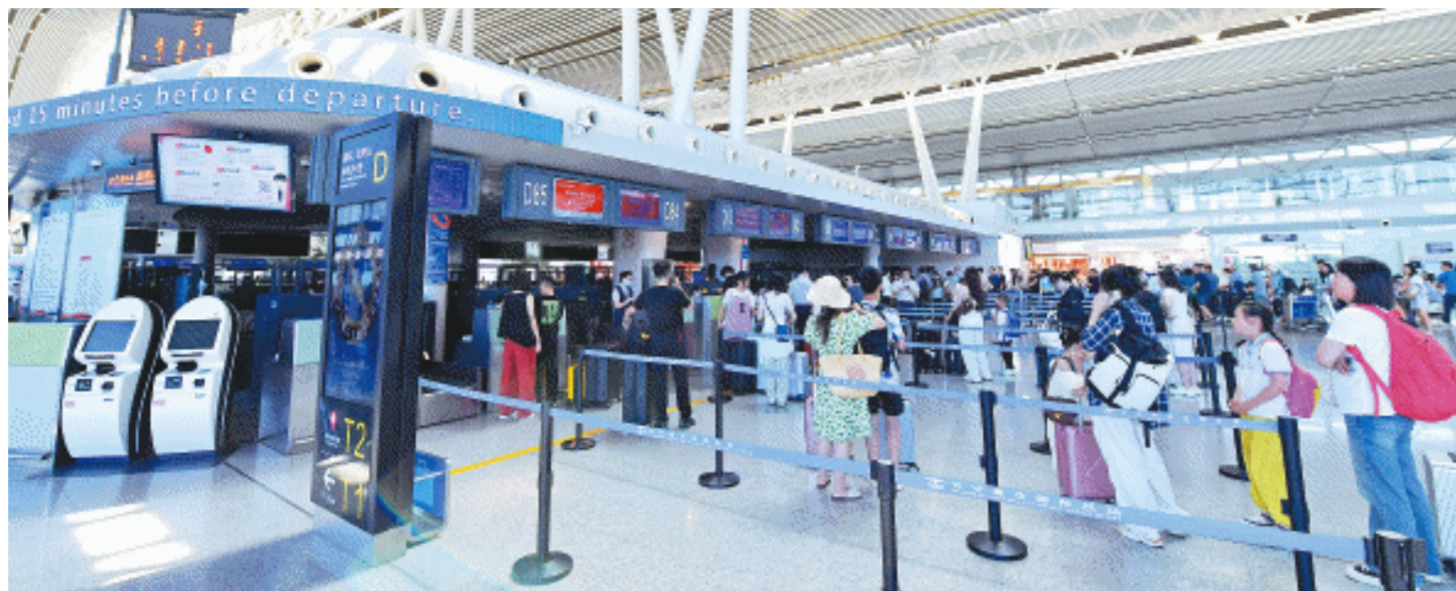
今年以来，长沙机场旅客总吞吐量已突破1600万人次，同比增长20%，暑期亲子游、出境游火热。

趁着暑期的火热，部分航空公司不仅在长沙加密热门航线的航班数量，还拓展新的航线。比如，7月12日，越南越捷航空将开通长沙往返越南芽庄航线，奥凯航空将开通长沙往返韩国济州航线。这让长沙市民外出旅游有了更多更便捷的选择。