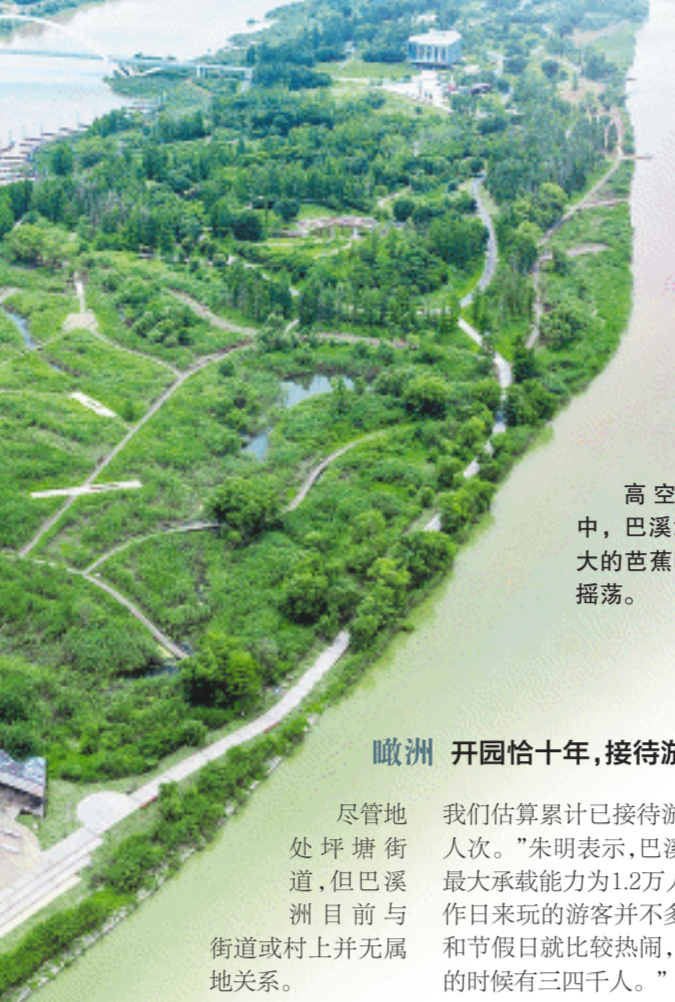
高空俯瞰镜头中，巴溪洲像一块巨大的芭蕉叶在碧波中摇曳。

芦苇繁殖能力超强。景区工作人员告诉走读团，原本只在南端洲头人工种植了15亩芦苇，如今洲上四周都有成片芦苇荡。