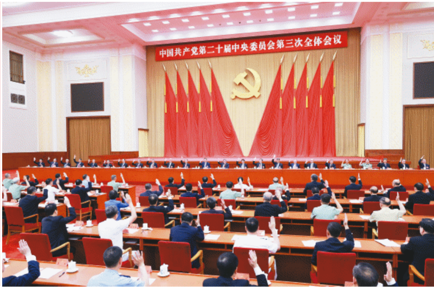
中国共产党第二十届中央委员会第三次全体会议，于2024年7月15日至18日在北京举行。中央政治局主持会议。