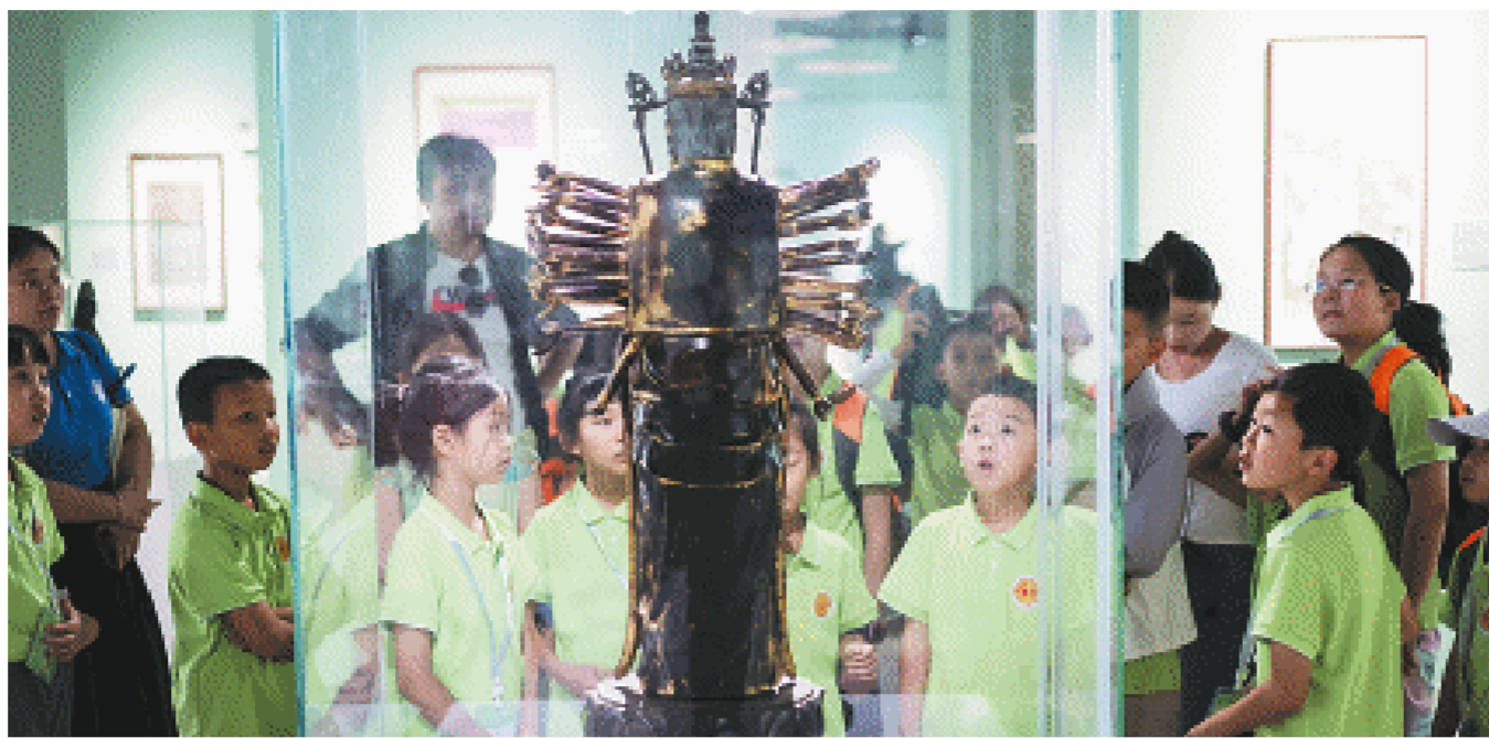
暑假期间,小朋友们正在博物馆研学、观展。

值得一提的是,大观仓还是一座“书香+”的博物馆,博物馆与新华书店联名在一楼开设了新华书店·大观书房。书房深耕细分领域的读者需求,精准选品,以精品艺术图书为媒介、以博物馆文化空间为载体。余华的《活着》、史铁生的《我与地坛》、路遥的《早晨从中午开始》等经典书籍轮番上阵,游客可以在艺术的世界里畅游书香的“海洋”。