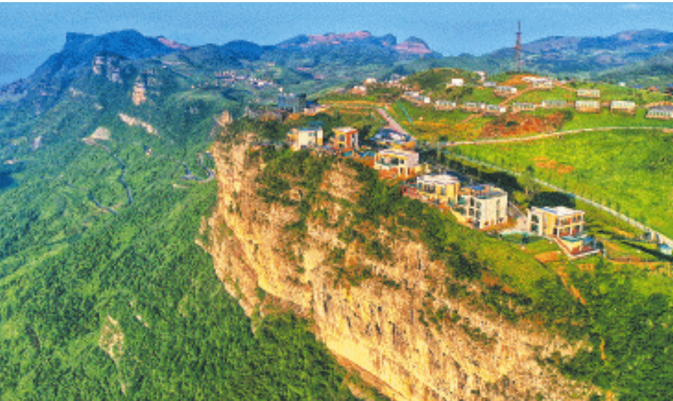
龙山多个景区对长沙市民免费。