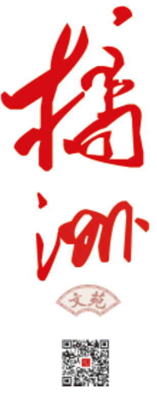
责编/张辉东 美编/吴志立 校读/肖应林

吹即萎——那是桃花娇弱的憾事,而是有了长于这一切又属于自己的特性。它们是一看就心事复杂的红、不卑不亢的绿,是红与绿经日长谈后不疾不徐有理有节的融合。它的甜度与香度恰到好处,不咬开不见其鲜妍,不前难享其馥郁,远观神秘迷离,近看令人遐想。