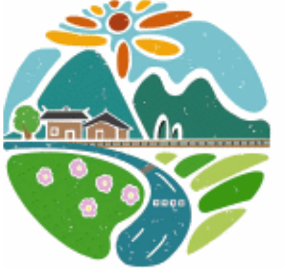
实践团成员设计的村logo。