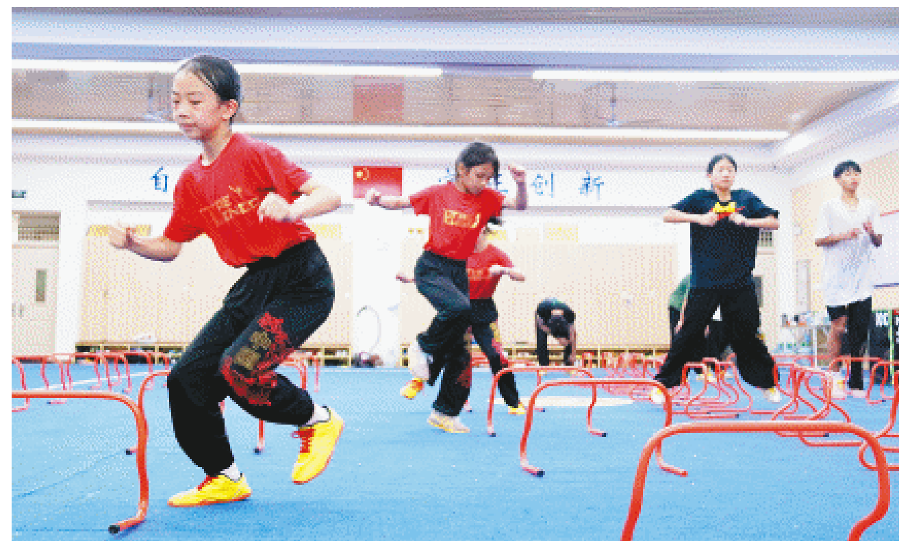
长沙市雅礼书院中学武术队队员正在进行体能训练。