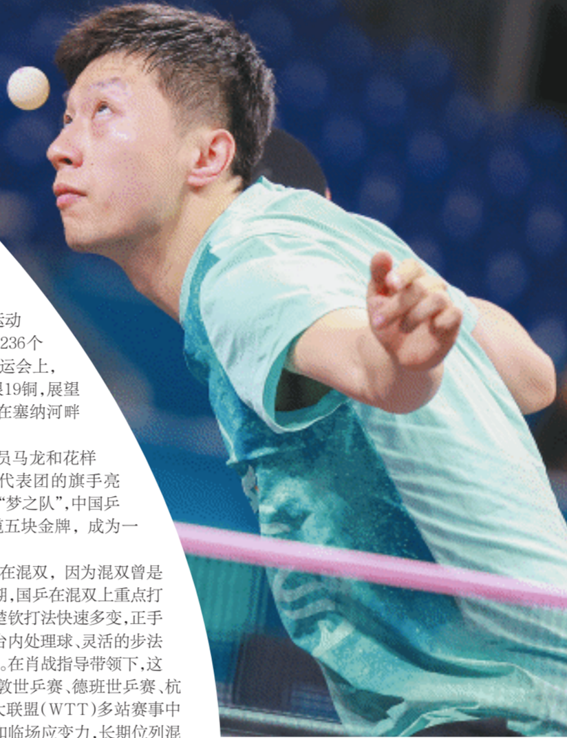
7月24日，中国队选手马龙在训练中。巴黎奥运会乒乓球项目将于7月27日迎来首个比赛日。

当我们在为众多健儿加油的时候，会更理解“更快、更高、更强——更团结”的意义，也许这正是我们需要奥运会的最大理由。