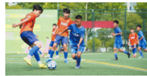
长塘里小学队(蓝衣)对阵韩国杨平小学队(橙衣)。

长沙晚报7月25日讯(全媒体记者 赵紫名)25日上午，2024湖南长沙德馨杯暨国际友城少儿足球邀请赛，在长沙市雨花区东升体育足球公园拉开帷幕。来自中国、日本、韩国的15支队伍，201位足球小将，汇聚在绿茵场，用体育架设友谊桥梁，共同演绎一场国际青少年足球盛会。