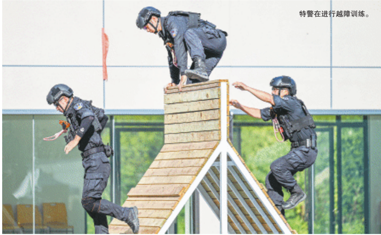
特巡警在进行越障训练。