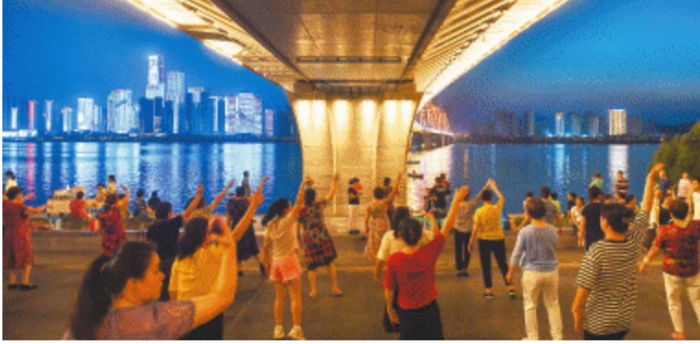
傍晚,福元路大桥东桥下,市民正在跳舞。均为长沙晚报全媒体记者 邹麟 摄