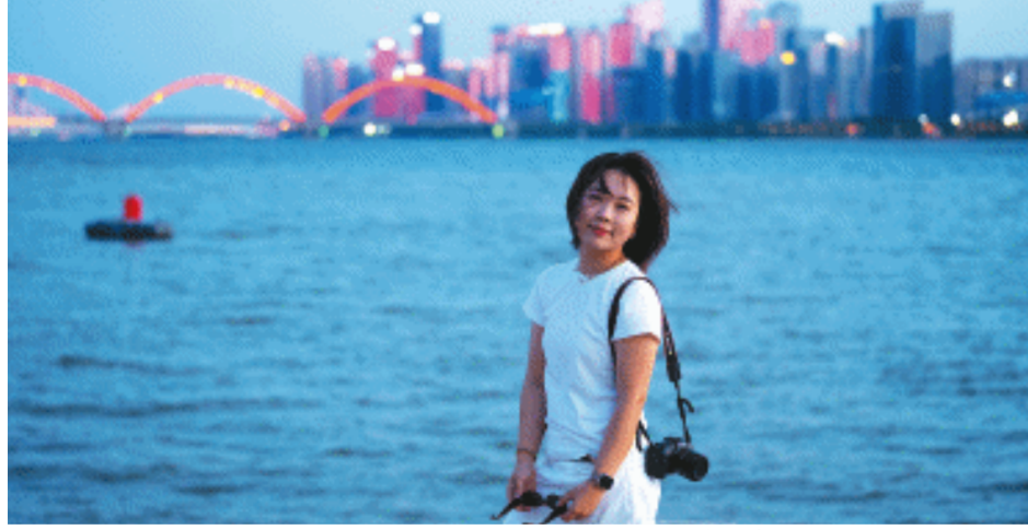
市民来到江边与彩虹桥合影。