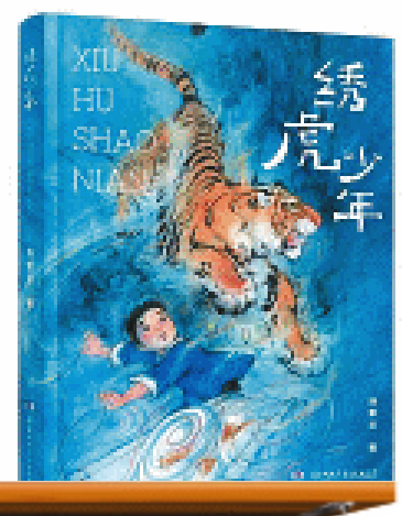
《绣虎少年》汤素兰著，湖南少年儿童出版社2024年4月版

汪曾祺讲：“使用语言，譬如揉面。面要揉到了，才软熟，筋道，有劲儿。”试举一例，“老房子的一天是从天井开始的。晨光最先跳进天井，再从雕花木窗格钻进四面房间里。”一先一后，一“跳”一“钻”，整个场景生动而有张力。大量有生活质感的典型场景与人物对话，真实呈现了社会的生态原貌，推动了故事的发展。《绣虎少年》的语言，有着直达心灵的敏感和细腻；《绣虎少年》的叙述，有着少见的干脆利落，清澈、简洁、流畅、好读。