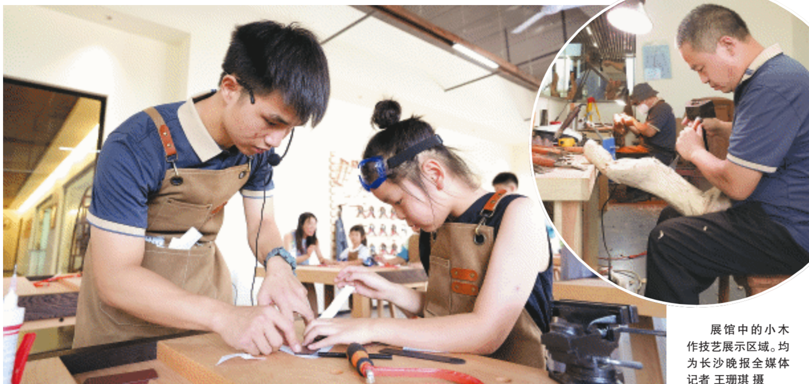
展馆中的小木作技艺展示区域。