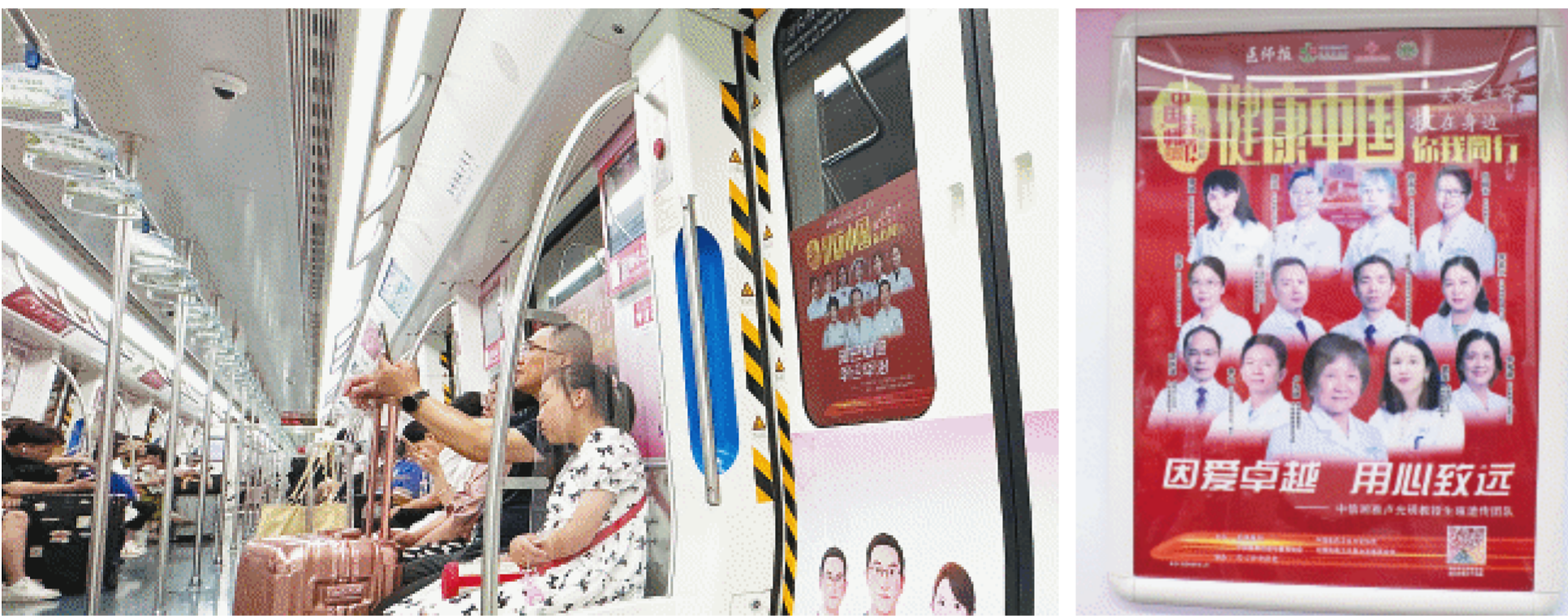
“致敬医师”主题地铁专列已启程,在未来一个月里,乘坐长沙地铁6号线的市民将有机会遇见这趟专列,与众多名医一起健康同行。

长沙晚报8月19日讯(全媒体记者 傅容容)8月19日是第七个中国医师节,“致敬医师”主题地铁专列正式启程。在未来一个月时间里,乘坐长沙地铁6号线的市民将有机会遇见这趟专列,与众多名医一起,享受健康同行的旅程。