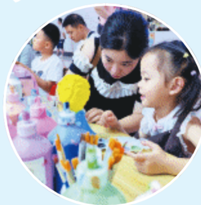
20日,长沙万家丽国际MALL广场儿童游乐区,不少家长带着小孩在这里游乐打卡。持续的高温天气,每天都吸引不少市民陪着孩子前来“赠凉”,同时也带热了商场消费。