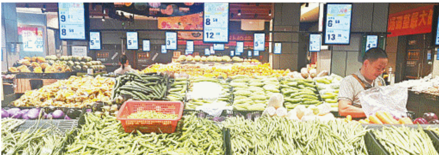
长沙部分超市内,部分蔬菜价格出现了明显上涨。

数据显示,上周11种蔬菜平均价格比前一周上涨10.5%,除豆角价格上涨外,丝瓜、黄