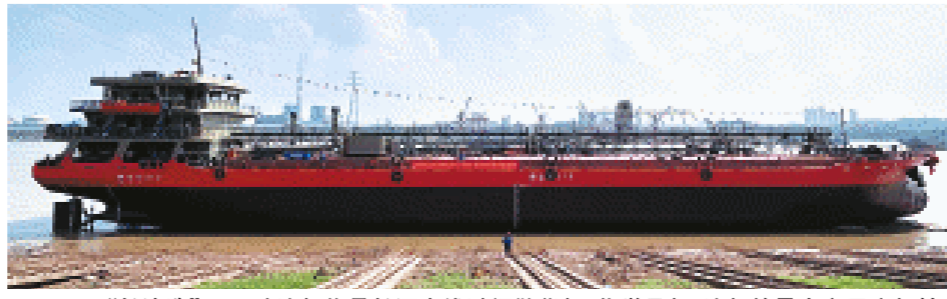
“长沙造”3500吨油船将是长江支线过闸散货船、化学品船、油船的最大主尺度船舶。

纸到整个船成型的过程。该船于去年8月4日开工，船长88米，型宽16.20米，型深5.45米，载重3500吨，主要载运货品为汽油和柴油。全船液货舱区域采用双底双舷、甲板有升高围阱的纵骨架结构。目前，该油船已完成的各项工序、技术指标经检验结果均达优良，将入级中国船级社。 下水，也就是下水，是一艘船从图