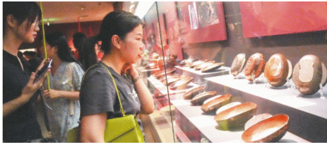
市民正在观看展览。