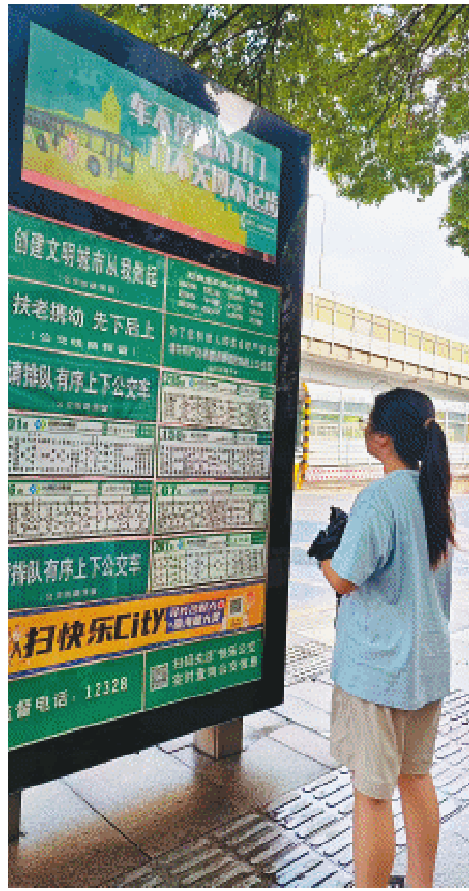
市民等候公交车的到来。

陈刚表示,省卫健委是国计之委、民生之委、改革之委、系统之委,积极守护人民群众生命安全和身体健康,奋力推进全省卫生健康事业高质量发展。期待湖南卫健系统在深入学习宣传贯彻全会精神中进一步统一思想、凝聚共识,始终坚持人民至上、生命至上,紧紧围绕全会提出的“实施健康优先发展战略”,为全省群众提供更加优质高效的卫生健康服务,为谱写中国式现代化湖南篇章贡献卫健力量。