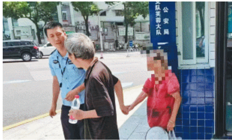
老人的儿子来到岗亭,牵着母亲回家。

一个小时后,老人的儿子来到岗亭。民警先出去与他交流,告知老人非常担心他,希望他不要责怪母亲,并嘱咐一定要照顾好老人,家属对民警的帮助感激不尽。