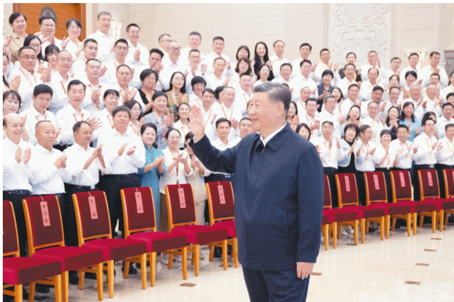
9月9日至10日，全国教育大会在北京召开。中共中央总书记、国家主席、中央军委主席习近平出席会议并发表重要讲话，代表党中央向全国广大教师和教育工作者致以节日祝贺和诚挚问候。