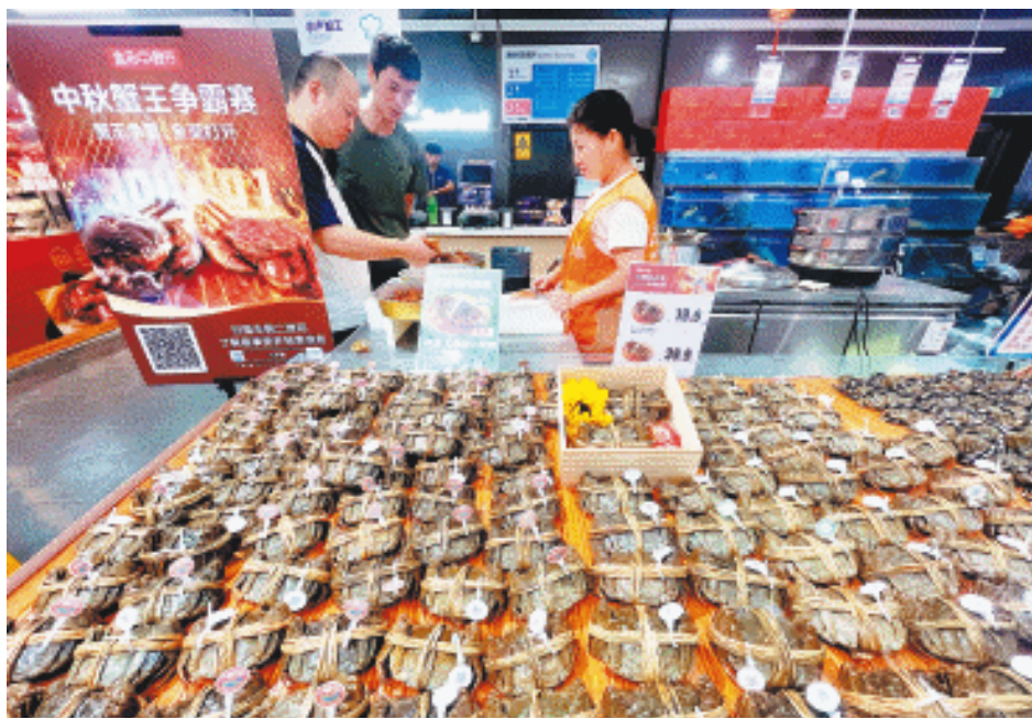
吃蟹季，“熬”过高温的大闸蟹批量上市。

但大规格高品质大闸蟹的价格预计会有所上涨。”李子涵说，想吃阳澄湖大闸蟹的消费者还得再等等，今年阳澄湖开捕时间预计在9月25日左右，“一开湖，就会马不停蹄地将新鲜