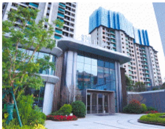
长房·浅山时光楼盘主打舒适度、松弛感。

买房，一定要看品质！造一套“好房子”，更是一个系统工程，要通过好标准、好设计、好材料、好建造、好服务，才能让消费者生活得更舒心、更安心。