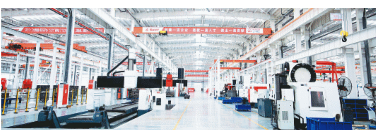
三一重工智能化生产车间。