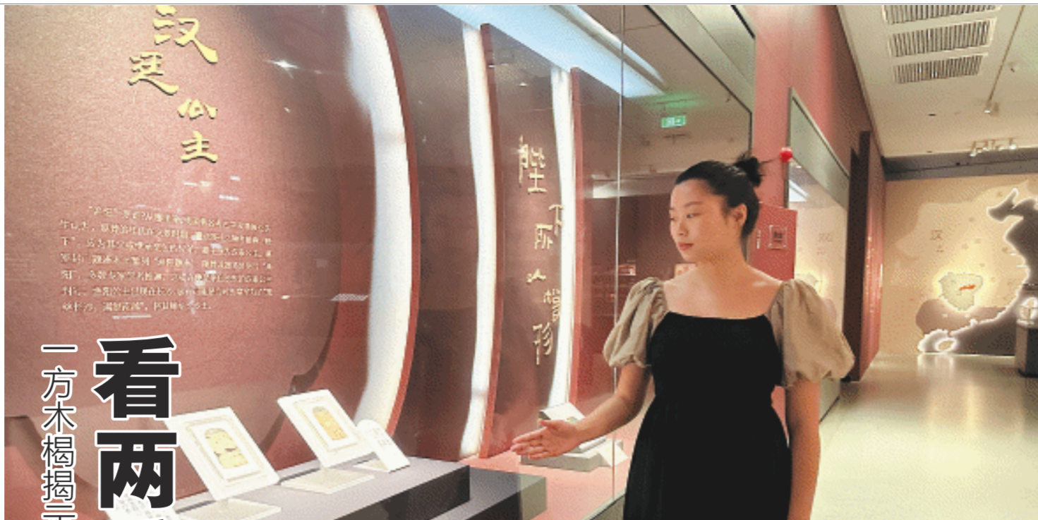
工作人员正在介绍特展文物。