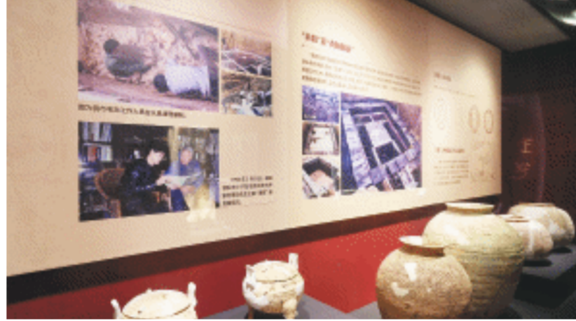
特展上的文物。

长沙博物馆的这个展览，不仅仅是一个展览，更可能是一种让人穿越时空的历史遐想。这个展览当然有理由成为湖南的最热展之一。