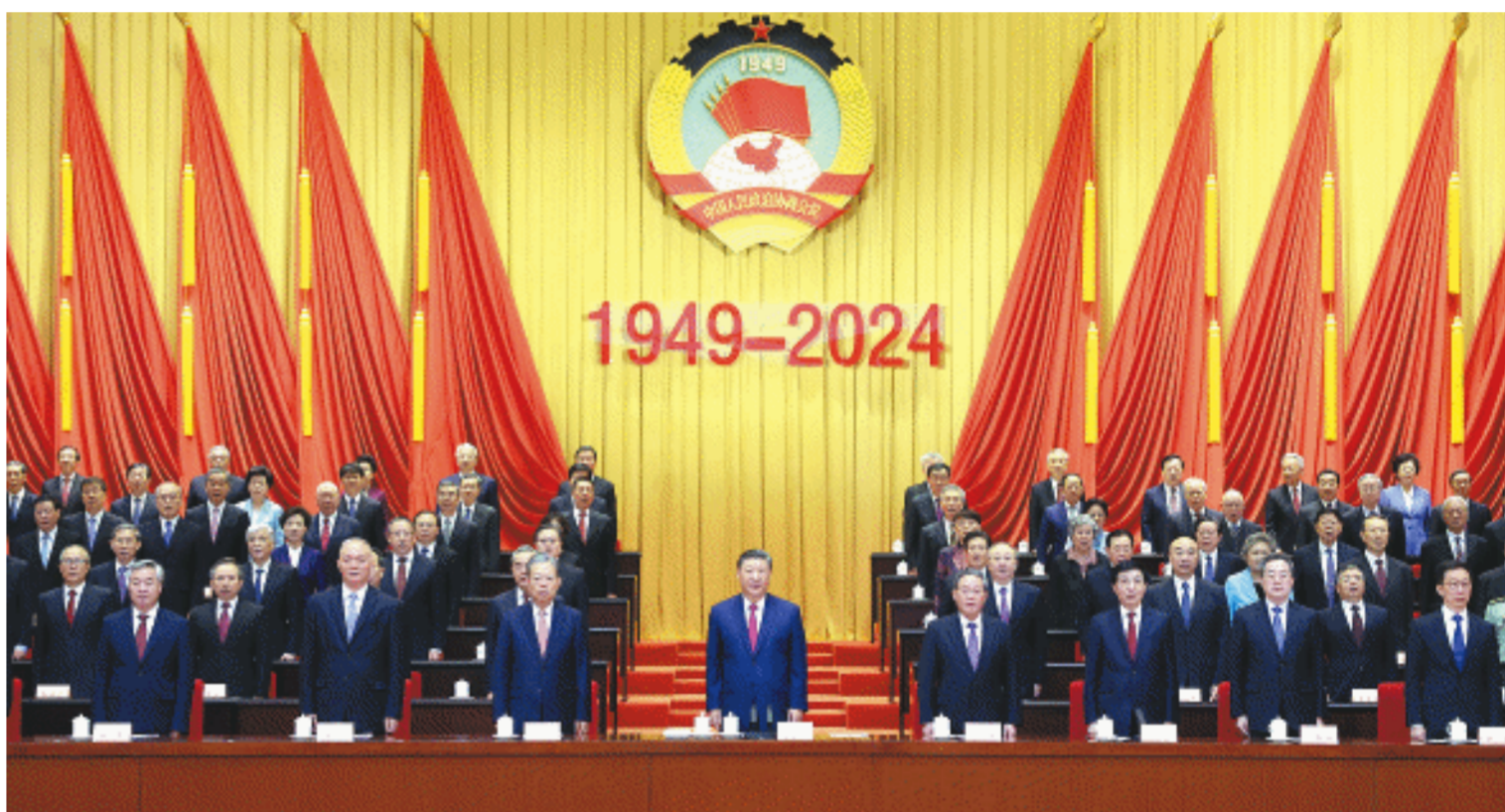
9月20日上午,中共中央、全国政协在全国政协礼堂隆重举行庆祝中国人民政治协商会议成立75周年大会。中共中央总书记、国家主席、中央军委主席习近平出席大会并发表重要讲话。