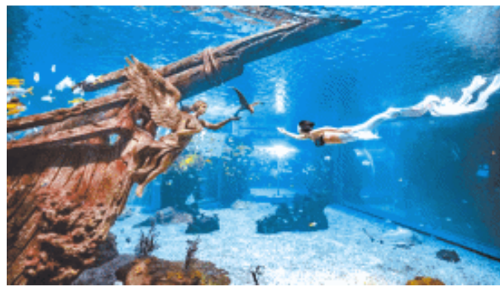
美人鱼表演

在社区公共空间中设置“茶摊档口”,为周边居民提供便利的同时,也使得老街区与现代化潮流地标奏出城市文旅交响曲,将成为吸引前来长沙观光的游客可喝可吃可听可看的城市新空间。