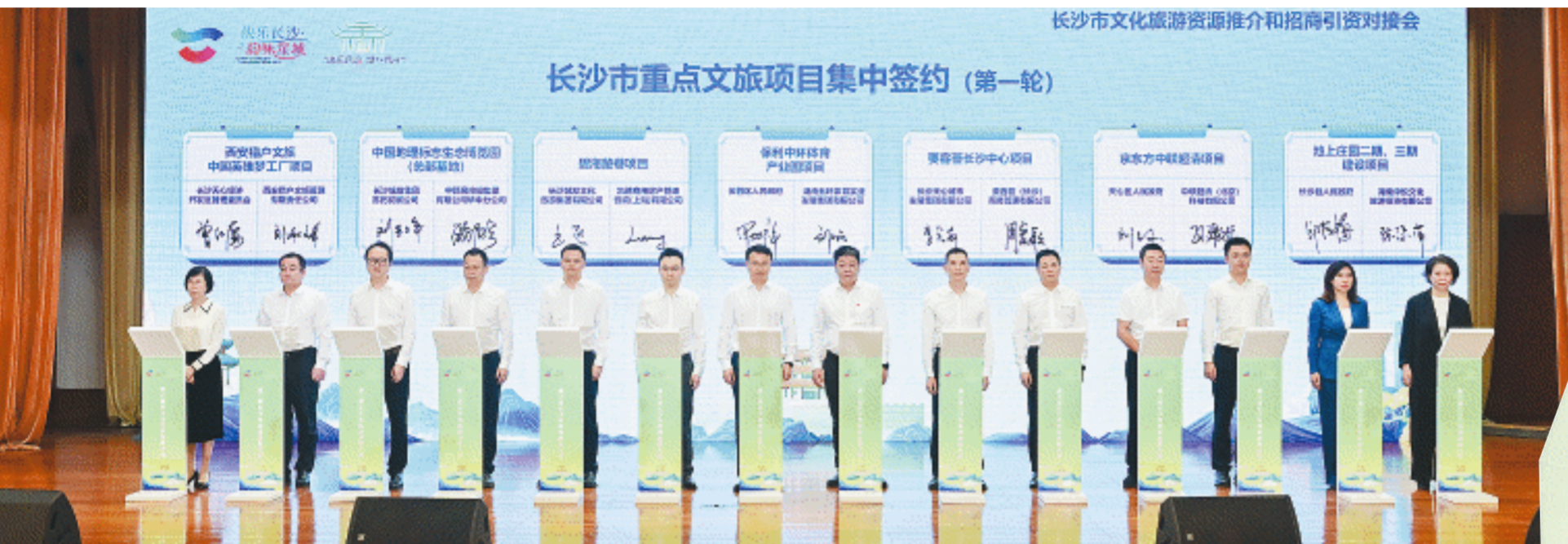
9月26日上午,长沙市文化旅游资源推介和招商引资对接会上,重点文旅项目集中签约。长沙晚报全媒体记者 余劭劭 摄

长沙晚报9月26日讯(全媒体记者 吴鑫矾)26日,在长沙市旅游产业发展推进会上,天心区、长沙城发文旅集团、望城区铜官街道等单位进行了交流发言,分享经验和特色举措。 高站位打造“来到天心、天天开心”的文旅高地,高质量推动“来到天心、处处走心”的文旅融合,高水平唱响“来到天心、人人称心”的文旅品牌,高标准深化“来到天心、时时暖心”的文旅护航……近年来,天心区坚持以文塑旅、以旅彰文,奋力打造全国文旅高质量发展示范样板,文化产业竞争力跃居全国百强区第10位,旅游综合实力排名全国百强区第56位,成功创建首批国家级旅游休闲街区、全省首个全国示范步行街,夜经济影响力排名全国20强区县首位。 天心区关于IP的打造也值得借鉴:打造了一批城市IP、市场IP、活动IP品牌,文和友、茶颜悦色、黑色经典等新消费品牌,以及长株潭融城半程马拉松赛等特色赛事活动品牌,吸引了无数市民游客。 今年5月,长沙城发文旅集团组建成立,依托长沙“山水洲城”的资源禀赋,助推城市品质与文化内涵交相辉映:持续美化“一江两岸”灯光秀,展现长沙夜晚的“城市新封面”;焕新升级杜甫江阁,上演江南“喜相逢”,上新江阁“唐装秀”,给游客带来沉浸式体验;在橘子洲头设置《恰同学少年》青春剧场,运用多媒体艺术表达,以“沉浸式+互动式”的模式打造“红色+”文旅新消费场景…… 铜官作为“千年陶都”“楷圣故里”“郭亮家乡”,近年来依托特色资源禀赋,不断夯实文旅融合发展根基;深耕“古色文章”,做长“网红经济”,打造国风焰火节、大唐奇妙夜等一系列网红IP;深耕“陶瓷文章”,做活“创意经济”,打造文创产业街区,搭建创客中心平台,吸引一大批青年创客、艺术家入驻;深耕“生态文章”,做亮“美丽经济”,先后引进一批农文旅项目,打造生态旅游精品线路;深耕“科技文章”,做实“数字经济”,打造国风乐园5D影院、《天觉湖南》大型历史剧等文旅新空间新场景,不断培育和创新发展新质生产力。