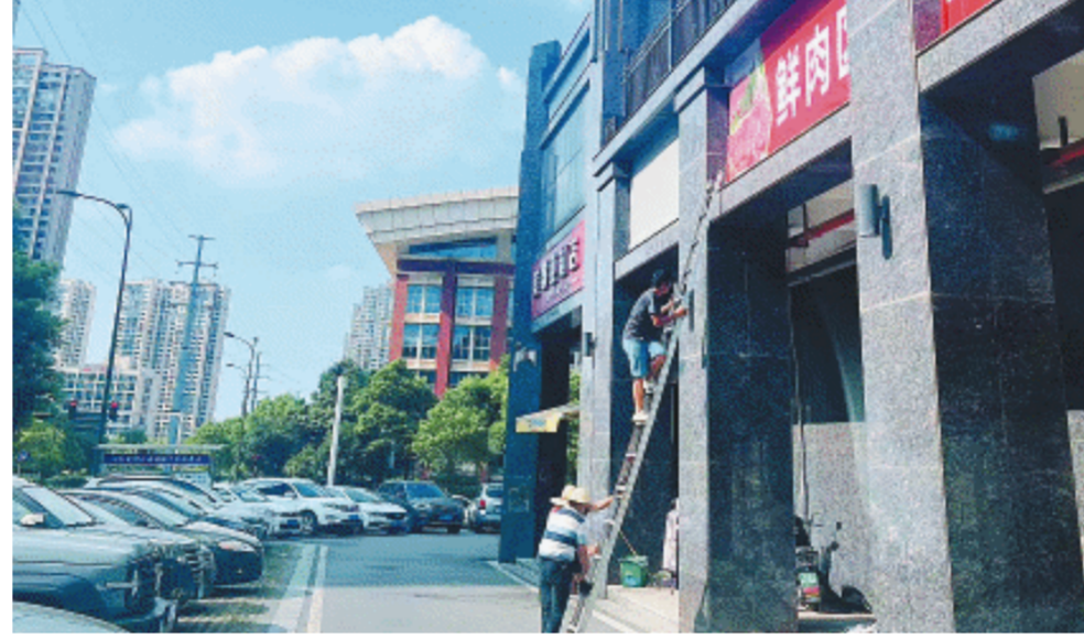
近日经营方对项目涉及的宣传广告、市场标志等进行拆除下架。 资料图片

“报道刊发后,望城区月亮岛街道组建了工作专班,迅速进行核实、调查、处置等工作,8月30日即在现场对全线涉及的违规宣传广告、市场标志等进行拆除下架。”月亮岛街道有关负责人表示,在认真听取业主意见后,街道要求经营方暂停所有签约门面的招租和装修,督促其按照行业主管部门要求、沿街商业门面性质,综合考