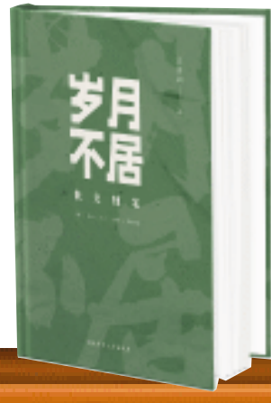
《岁月不居》/庄居湘著/湖南师范大学出版社/2024年6月

这些天，小院里，一树树桂花正在盛开。让我摘一枝芬芳的桂花，献给《岁月不居》，赞美这位双手运笔写人生、绘春秋的女士！