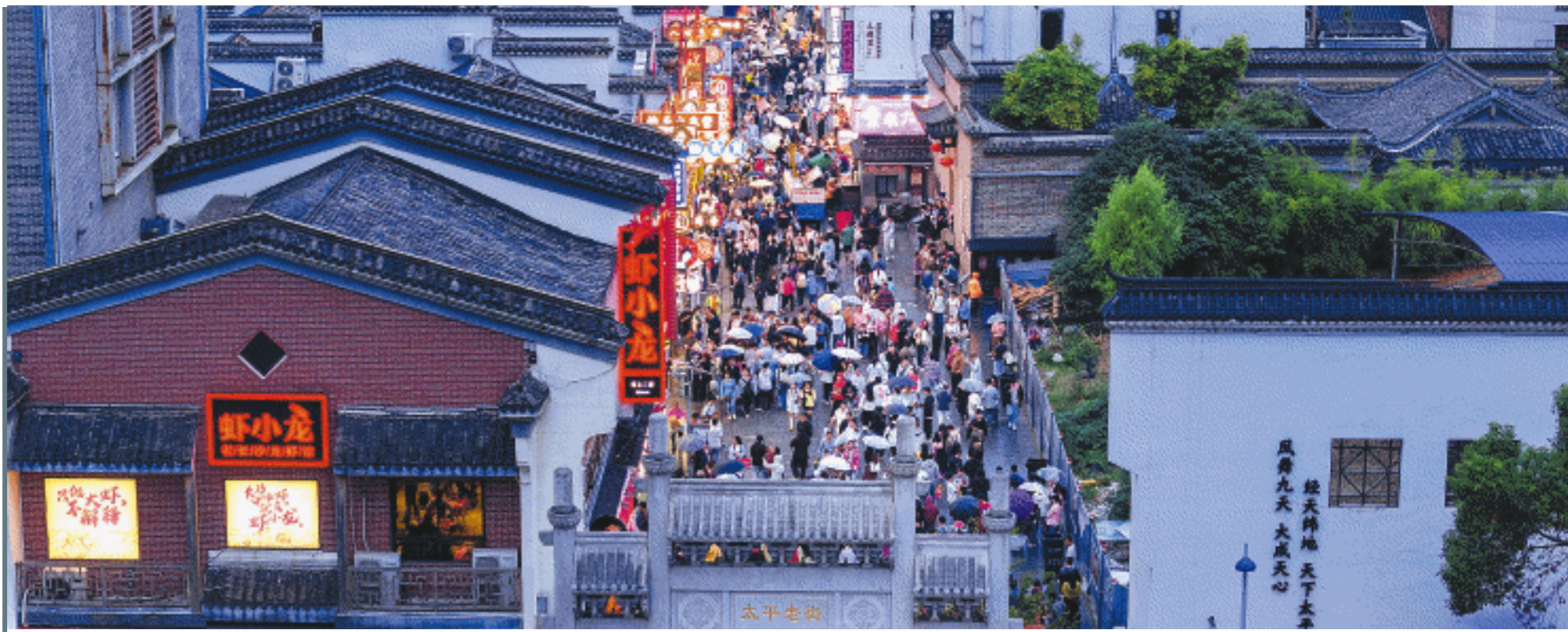
1日，记者在长沙国金中心、太平老街等地看到，街头巷尾国旗飘扬，处处是洋溢着笑脸的游人。

湖南省庆祝新中国成立75周年影片展映展播活动从9月30日正式开启，贯穿全年。展映展播《志愿军：存亡之战》《危机航线》《出入平安》《749局》《浴火之路》《只此青绿》《熊猫计划》《爆款好人》等20部优秀、经典的主旋律影片。