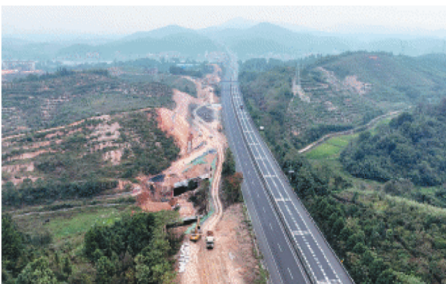
10月15日,G4京港澳高速耒宜改扩建北往南封闭施工启动。

梁、架梁专题会议,制定了完善的吊装方案和应急预案,并对作业人员进行架梁技术、安全质量交底。项目技术和安全人员对架梁施工全程管控,严格执行吊装作业安全操作规程,实现了首片箱梁的安全精准架设。