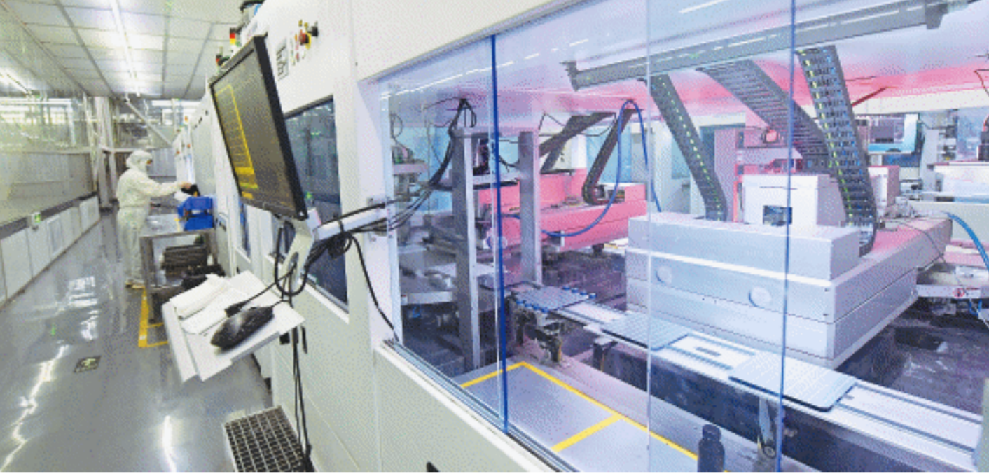
红太阳新能源的“智造”车间。

腐蚀之后,还得炙烤。记者来到“烤箱”前,热浪滚滚。烹饪讲究火候,高温镀膜环节,对于温度的掌控更为苛刻。“炉内要快速从15℃升到900℃,且偏差不能超过1℃。”雷坤解释,这一步骤是为了让三氯氧磷能够有效渗入。