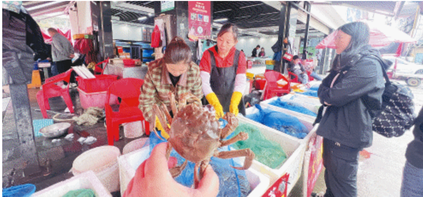
马王堆海鲜市场大闸蟹迎来销售旺季。

秋蟹肥美正当时。部分商家看中消费者对于大闸蟹消费便捷或者送礼的需求,推出各种配置的蟹卡蟹券。每到这个季节,就有消费者反映,兑换蟹卡蟹券时“卡壳”的情况不少,或是始终预约不到提货时间,或者货不对板不予赔付。遇到这些“纸螃蟹”消费侵权的情况,消费者要怎样做?记者连日来进行了走访调查。