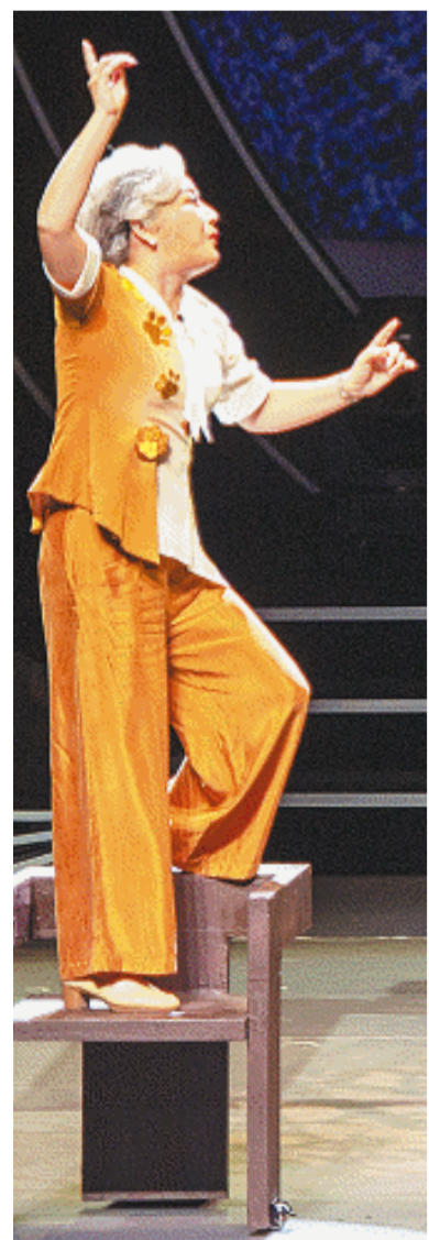
开幕式展演环节,湘剧《一盞摊灯》、长沙花鼓戏《审猫》、小品《青春典当行》、邵阳花鼓戏《提灯正传》精彩上演。