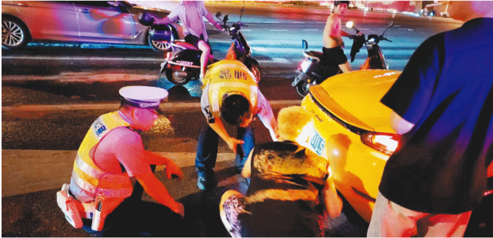
8月,在三一大道的路口,针对机动车非法改装排气,噪声扰民,长沙交警现场进行查处。

究竟是哪些人在“狂飙”?什么时段、哪些路段多发?那些狂飙的车辆是在哪里改装的?为何难以根治?……带着这些疑问,从盛夏到初秋,长沙晚报记者开始了为期两个多月的深入调查。