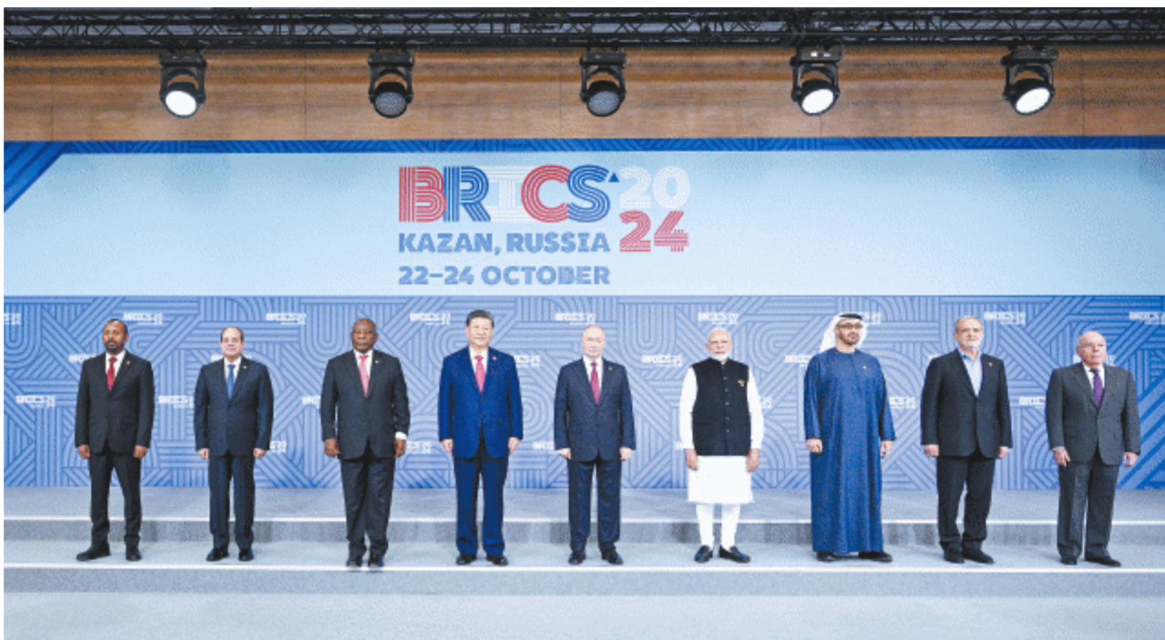
当地时间10月23日上午，金砖国家领导人第十六次会晤在喀山会展中心举行。俄罗斯总统普京主持会议。中国国家主席习近平、巴西总统卢拉(线上)、埃及总统塞西、埃塞俄比亚总理阿比、印度总理莫迪、伊朗总统佩泽希齐扬、南非总统拉马福萨、阿联酋总统穆罕默德等出席。这是会晤期间，金砖国家领导人集体合影。