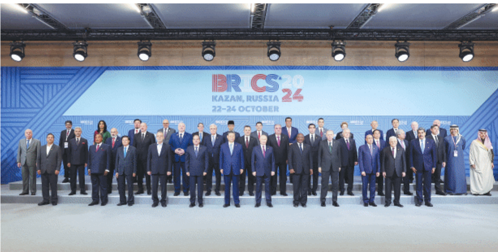
当地时间10月24日上午，国家主席习近平在喀山会展中心出席“金砖+”领导人对话会并发表题为《汇聚“全球南方”磅礴力量 共同推动构建人类命运共同体》的重要讲话。