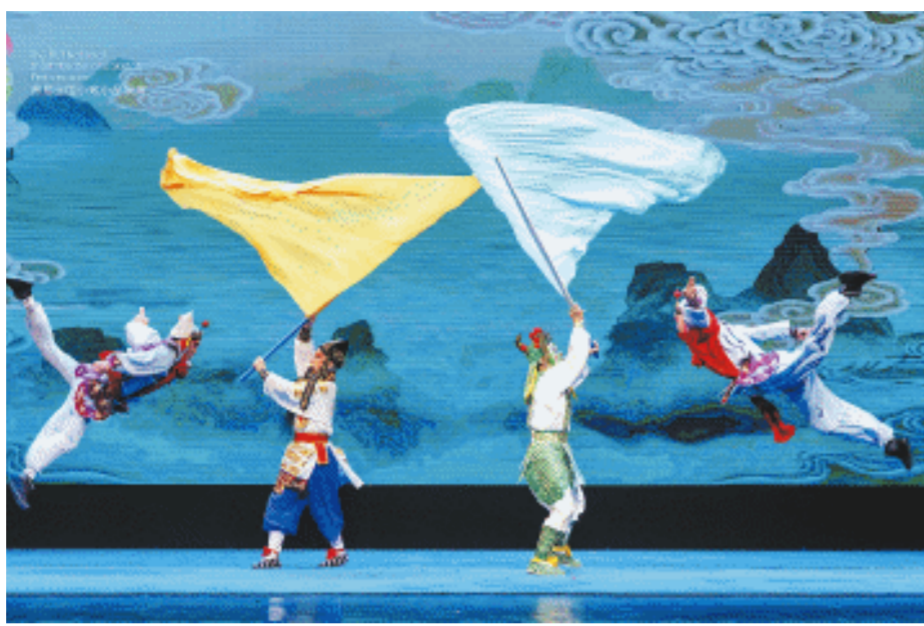
晋剧《双龙戏八仙》表演。