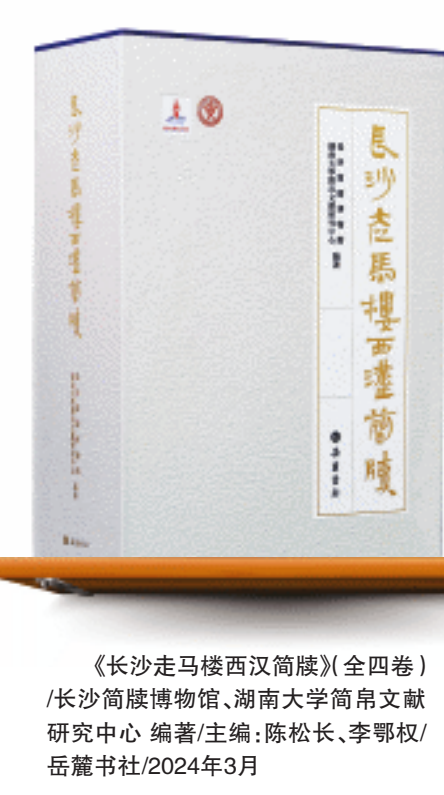
《长沙走马楼西汉简牍》(全四卷) /长沙简牍博物馆、湖南大学简帛文献研究中心 编著/主编:陈松长、李鄂权/岳麓书社/2024年3月

以上几类,是长沙走马楼西汉简牍中所见到的常见几大种类,在岳麓书社出版的《长沙走马楼西汉简牍》中均有