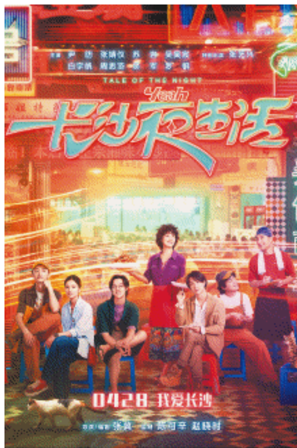
《长沙夜生活》电影海报

电视湘军、电影湘军扬名全国,也为网红长沙的文旅事业注入了新动能,电影“安利”、文旅引流实现了双向奔赴。《长沙夜生活》创新性地以城市作为主角,实现了新时代“电影+文旅”“电影+城市”梦幻联动的大胆探索与全新突破。电影热映时,不少游客就拿着电