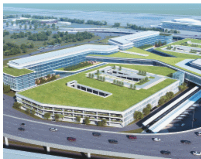
项目效果图