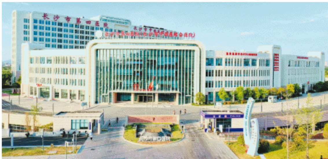
长沙市第四医院坚持中西医协同发展,发展重点学科、特色专科,让群众享受到更优质的医疗健康服务。图为长沙市第四医院滨水新城院区概貌。

去年8月,医院首次实施“四类”高层次人才培育方案,第一批选拔了64名高层次人才进行培育,对人才实施全方位培养,并实行动态考核机制。今年9月,医院有10名专家入选长沙市卫生健康高层次人才,为医院高质量发展注入了新活力。