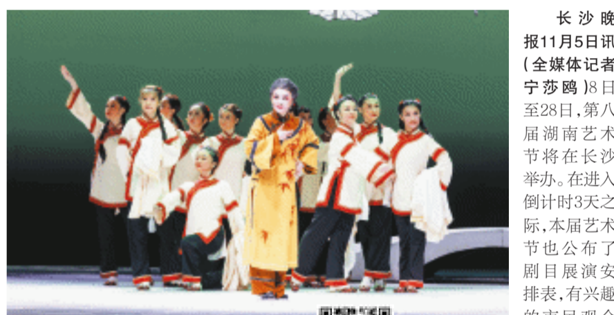
湘剧《夫人如见》将作为第八届湖南艺术节新创大戏展演的开幕大戏。资料图片