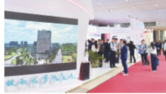
雨花区作为全省唯一的国家进口贸易促进创新示范区,首次布展进博会。

一旁的人工智能与高端装备进口中心,一批“雨花造”惊艳亮相。中轻长泰、大族激光、钛合电子等企业展示着代表行业前沿的高端产品。雨花区不仅在展示上独具匠心,还积极举办各类活动推动经贸合作。除了举办国家进口贸易促进创新示范区推介会外,雨花区还举办了湖南市场采购贸易方式试点推介会,50余家企业和老字号积极参与,共同探索进出口、内外贸有机结合的新路径。