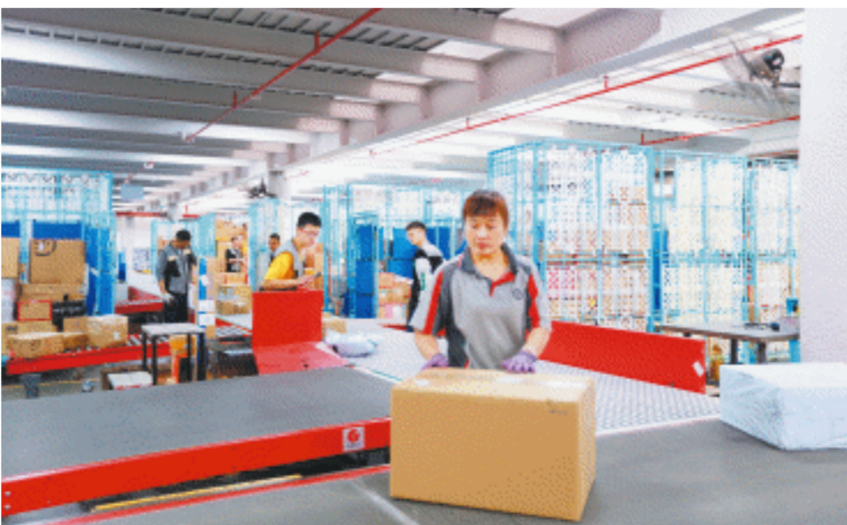
11月11日，湖南顺丰速运有限公司长沙盛祥分拨中心，工作人员正在处理包裹。自动化分拣设备的使用大大提高了快递的运转效率。

11月11日上午，记者走进湖南顺丰速运有限公司长沙盛祥分拨中心，各类包裹通过纵横交错的传送带快速前进。在10条摆轮