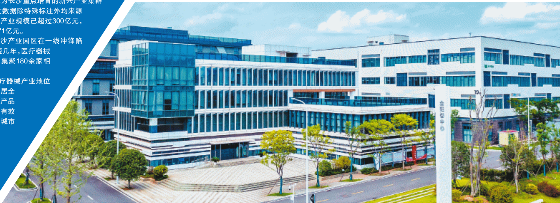
浏阳经开区的金阳智中心,集聚了多家来自全国各地的医疗器械企业。