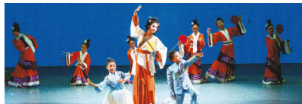
11日晚，第八届湖南艺术节湖南省戏曲进校园启动仪式在省音乐厅举行。

长沙晚报11月11日讯(全媒体记者 宁莎鸥)11日晚，第八届湖南艺术节湖南省戏曲进校园启动仪式在省音乐厅举行。少儿花鼓情景剧《我的长沙我的城》，以独特的魅力征服了现场观众。