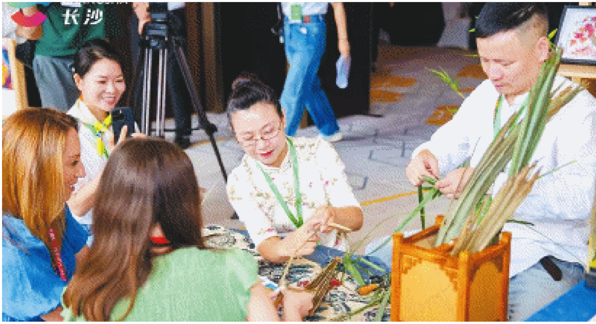
在2024长沙入境旅游市场对接交流活动中，长沙棕叶编备受关注。

通过讲解+志愿服务的形式，向全社会进行招募。通过系统的非遗讲解培训、趣味的非遗课程体验，为长沙非遗培育了一批向世界各地游客讲述长沙人文历史、传承和弘扬湖湘优秀传统文化的“非遗传播使者”，壮大了非遗服务队伍，激发全民对非遗的关注度和参与度。