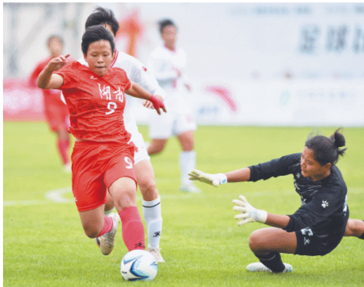
11月18日，第一届全国青少年三大球运动会女足比赛在岳阳开踢，位于D组的湖南女足坐镇湖南民族职业学院足球场迎战河北女足。

根据竞赛日程安排，男子足球、女子排球已于11月17日在长沙开赛，女子足球于18日在岳阳开赛，现场组织情况良好，比赛顺利有序进行。国家体育总局青少司相关负责人表示：“参加本次决赛阶段的很多运动员，有可能出现在2028年洛杉矶奥运会、2032年布里斯班奥运会和以后的世界大赛上。”