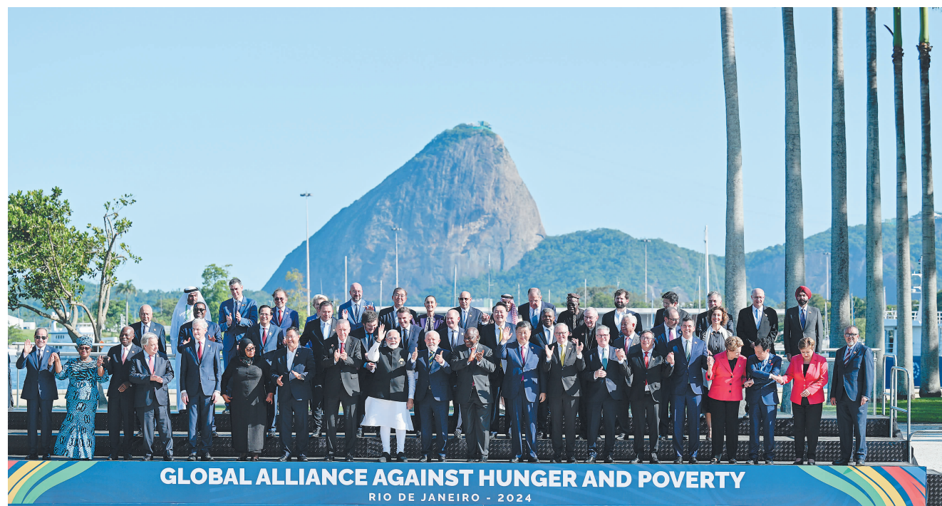
GLOBAL ALLIANCE AGAINST HUNGER AND POVERTY RIO DE JANEIRO - 2024

当地时间11月18日上午，国家主席习近平在巴西里约热内卢出席二十国集团领导人第十九次峰会。峰会把“构建公正的世界和可持续的星球”作为主题，并决定成立“抗击饥饿与贫困全球联盟”。这是习近平同与会领导人共同参加巴方发起的“抗击饥饿与贫困全球联盟”合影。