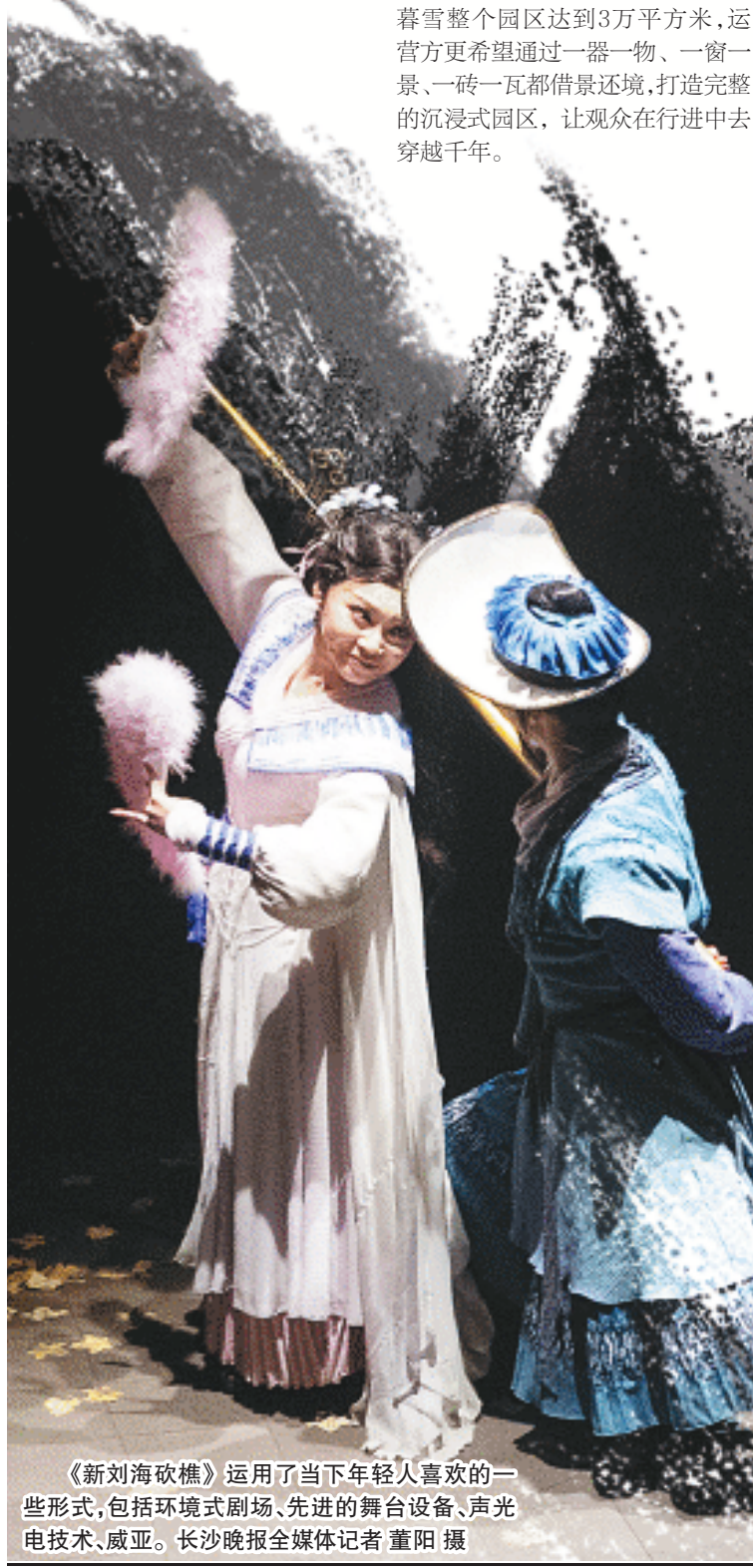
《新刘海砍樵》运用了当下年轻人喜欢的一些形式,包括环境式剧场、先进的舞台设备、声光电技术、威亚。

“技术越发展,艺术就越重要,越成为人的基本需要,更加成为人类的精神港湾。在此,传统和经典就更加重要和珍贵,需要我们去创造性转化和创新性发展,承前启后,与时偕行。”韩生说。