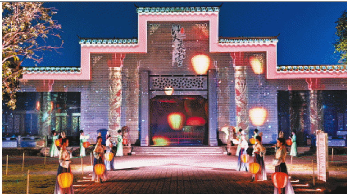
江天暮雪文化园依托潇湘八景之“江天暮雪”历史精髓,以湖湘文化为根基,以数字艺术为媒介,呈现了湖湘文化中宋朝的几个片段。

“目前我们有四个小剧场,后期还有一个大秀,剧场和大秀其实只是我们园区的一部分。”运营该项目的华夏芙蓉文旅江天暮雪项目组市场部推广经理郭昕莹表示,江天暮雪整个园区达到3万平方米,运营方更希望通过一器一物、一窗一景、一砖一瓦都借景还境,打造完整的沉浸式园区,让观众在行进中去穿越千年。