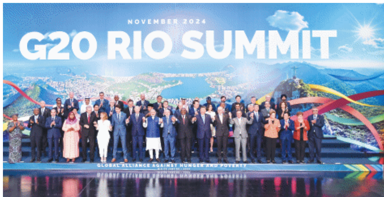
当地时间11月19日中午，国家主席习近平在里约热内卢出席二十国集团领导人第十九次峰会闭幕会议。这是闭幕会议后，习近平同与会领导人合影。

新华社里约热内卢11月19日电 当地时间11月19日中午，国家主席习近平在里约热内卢出席二十国集团领导人第十九次峰会闭幕会议。