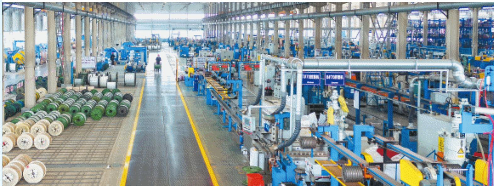
金龙集团厂房内，自动化生产线正有序运转。